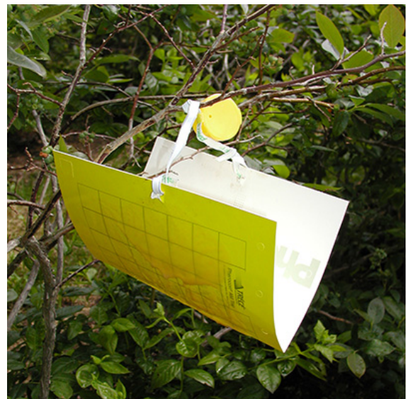
Daim duab 5. Daim ntawv nplaum nplaum xim daj muab quav V-orientation rau tswj seb puas muaj cov yoov noj txiv berry los tsaws (Rufus Isaacs, MSU).

Lub tsev kawm ntawv qib siab hauv lub lav Michigan State University (MSU) tshawb fawb pom tau tias thaum lawv sim ntawm ib daim teb txiv blueberry es muaj cov kab no ntau ntau thiab thaum txuag cov tshuaj li ntawm 2 asthiv ces tsum tsis txuag, mas cov tshuaj hu ua spinosyn insecticides no mas tua tau cov kab blueberry maggot no zoo heev. Ntxiv mus thiab, hom tshuaj Exirel yog ib hom tshuaj tshiab los lawm ntawm diamide chemical class es kuj siv tau tua thiab tswj tau cov kab bluemaggot no zoo heev li raws li lub tsev kawm ntawv qib siab MSU tau sim los lawm.