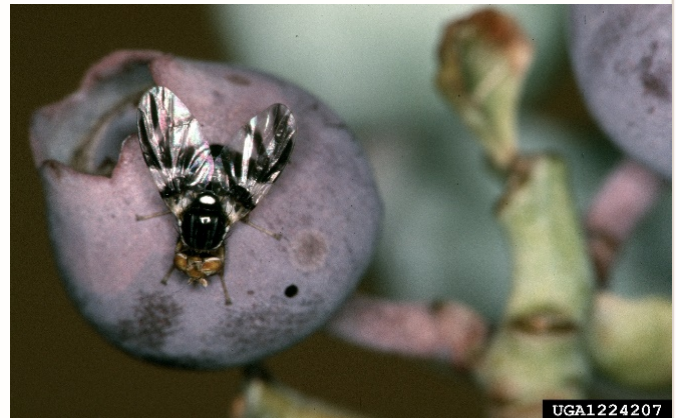
Daim duab 1. Tus kab Blueberry maggot loj txaus (Jerry A. Payne, USDA Agricultural Research Service, https://bugwood.org/ ) https://bugwood.org/

Tus kab blueberry maggot thaum laus txaus lawm ces yog ib tug yooov xim dub ci ci es ntev pab mas li ½ cm. Qhov qhia tau tias nws txawv tus yooov ces yog nws lub cev ntawm qhov nruab nrab dub dub thiab ci ci es muaj ib tee dawb dawb nyob sab saud (scutellum), thiab daim tis mas pom tshab