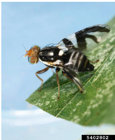
Daim duab 3. Tus kab R. pomonella loj txaus ua yoov (Joseph Berger, https://bugwood.org/ ).

Tom qab lawv ya tau lawm, cov maum yoov no mas ya tsis so mus nrhiav kua paj qab zib ntxais. Cov maum yoov no yuav tsum siv li 7 mus rau 10 hnuv es thiaj li txog caij rau lawv sib tshov, ces tom qab ntawd lawv mam li pib nteg qe. Cov qe mas siv lawv tus ple nkaug thiab nteg rau hauv qab daim tawv ntawm lub txiv pos blueberry es tab tom yuav siav, es yog nteg ib lub rau ib lub txiv pos blueberry twg. Cov qe no daug li ntawm tsib hnuv thiab daug tau ib tug kas ces nws pib noj lub txiv, thaum noj tag nrho ib lub txiv lawm ces lawv loj txaus lawm. Thaum lawv loj txaus lawm, tus kas no poob mus rau hauv av thiab nkag mus nkaum hauv av ces ua ib lub plaub rau lawv nkaum, lawv yuav nyob twj ywm hauv txog thaum lub caij ntuj nplooj ntoos hlav.