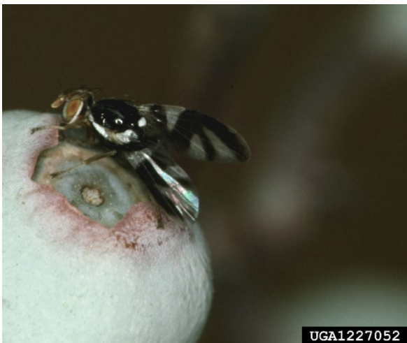
Daim duab 2. Tus kab R. mendax loj txaus ua yoov.

Thaum lub caij ntuj no mas cov kab blueberry maggots no thaum pib ces yog nyob hauv ib lub plaub ntawm cov av los yog pupae. Hauv lub lav Southwest Michigan, tus kab loj txaus ua tus yoov ya rau thaum lub asthiv kawg ntawm lub Rau hli ntuj dhau plaws lub Xya hli mus txog thaum pib ntawm lub Yim hli ntuj (Isaacs 2017). Raws li ib txwm paub mas, thaum lawv loj txaus ua tus yoov ces yog ncaj rau thaum lub caij es cov txiv pos blueberry tab tom pauv xim.